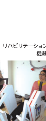
リハビリテーション機器