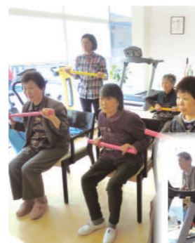
小集団リハビリ体操