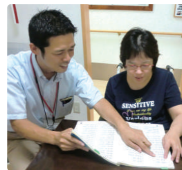
言語聴覚士による訓練

言語聴覚士による訓練や、手工芸などの活動を通し、利用者様同士の楽しい交流の場を提供します。